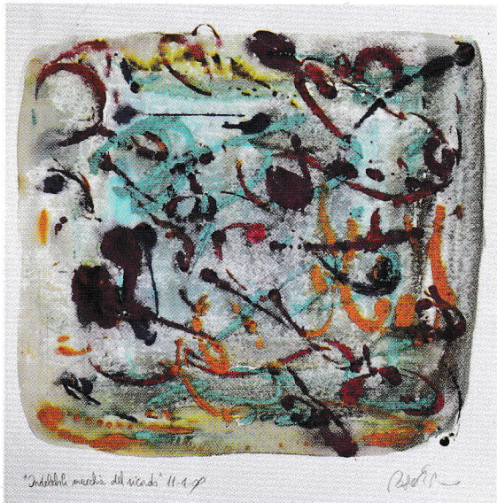
Rosa Pierno "Indelebili macchie del ricordo" 2009 acquarello.

Le mostre presso lo Spazio espositivo La Cornice si possono liberamente visitare dal lunedì al venerdì nell'orario 8.00 /12.00 e 14.00 /18.30, sabato 9.00/12.00. Una buona parte di opere è costantemente visibile dall'esterno nelle ampie vetrine della galleria-negozio La Cornice, in centro città a Lugano, Via Giacometti 1.